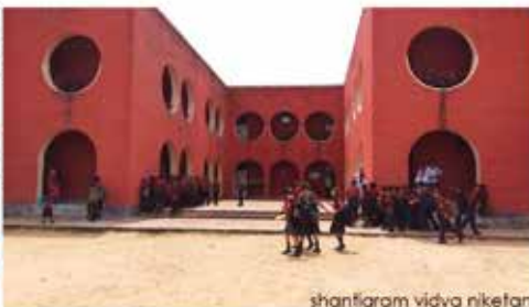
shantigram vidya nikanan

A herculian task of COMMUNITY DEVELOPMENT was set rolling by providing basic stress on three major aspects namely EDUCATION, MEDICAL AND WOMEN EMPOWERMENT.