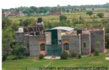
women empowerment Centre

Shantigram vidhya Niketan School: with a head count of 538 students that hail from around 30 villages, the school succeeds in torching young minds by bracing them towards a bright future. The school lays stress on the holistic development of a child by providing them quality education.