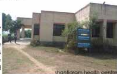
shantigram health centre

WOMEN EMPOWERMENT: from the very beginning emphasis was laid on the upliftment of the women by equipping them for a stable tomorrow. In this regard frequent awareness programs are held. To make them self reliable and provide with a stable source of livelihood various training classes are conducted.