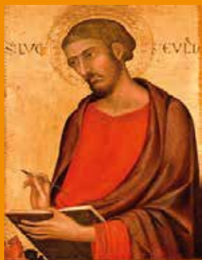
About St. Luke the Evangelist Companion of St Paul

St. Luke, the writer of the Gospel and the Acts of the Apostles, has been identified with St. Paul's "Luke, the beloved physician" (Colossians 4:14)